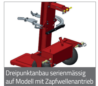
Dreipunktanbau serienmässig auf Modell mit Zapfwellenantrieb